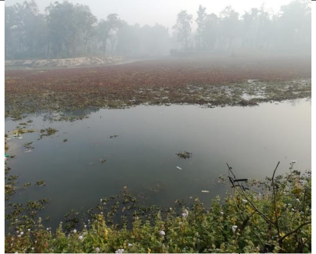
जाखोर ताल (JAKHOR LAKE)