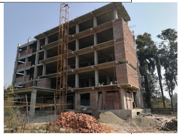
उप-महानगरपालिका निर्मानाधिन भवन (Underconstuction Sub-metropolitan building)